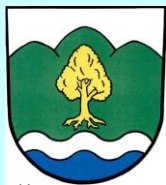
Řeka - CZ