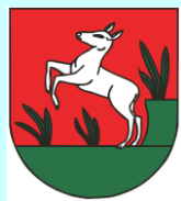
Stará Bystrica - SK