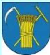
Jaworze - PL